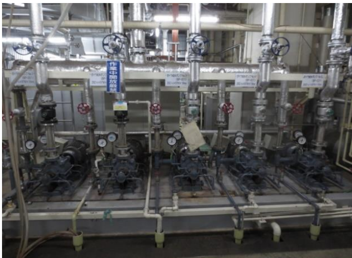
ボイラー給水ポンプ (ボイラー付属品)