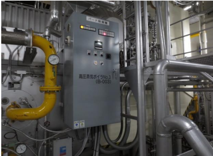
バーナー制御盤 (ボイラー付属品)